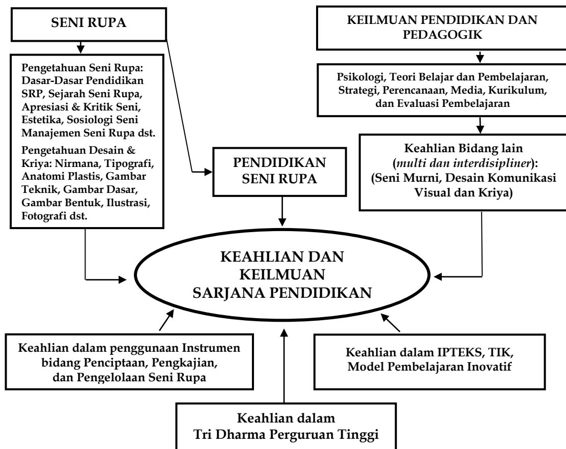
Bagan 1 Diagram Alir Body of Knowledge Prodi S-1 Pendidikan Seni Rupa

Body of knowledge yang diselenggarakan oleh Prodi S-1 Pendidikan Seni Rupa FBS UNP mencakup bidang ilmu pendidikan seni rupa dan bidang ilmu pendidikan lainnya yang sesuai dengan pembelajaran seni rupa. Keilmuan tersebut memiliki konstelasi dengan bidang sejenis pada tingkat S-2 dan S-3, bahkan menjadi multi dan interdisipliner bagi bidang ilmu Seni Murni, Desain dan Kriya. Oleh sebab itu, bidang keilmuan yang diselenggarakan menjadi bekal yang memadai untuk meneruskan ke strata yang lebih tinggi, baik Pendidikan Profesi Guru (PPG) ataupun strata dua (S-2) dan Strata tiga (S-3) bidang pendidikan atau ilmu seni, budaya dan desain. Adapun diagram alir dari body of knowledge Program Studi Pendidikan Seni Rupa FBS UNP secara umum dapat digambarkan pada Bagan 1.